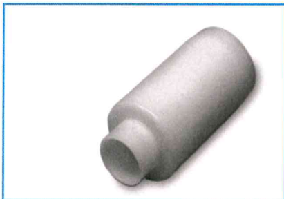
T-Safe® dummy filter t.b.v. wanddouche