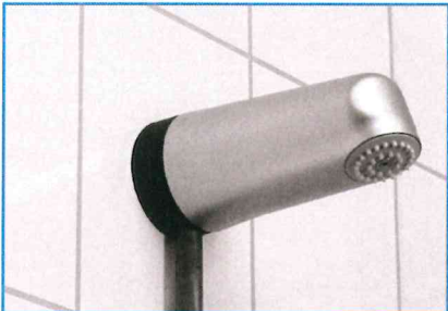
T-Safe® Flex Wanddouche