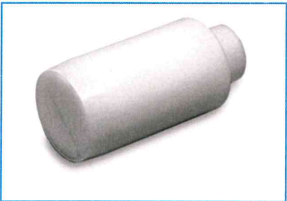
T-Safe® Wanddouche filter